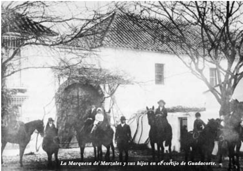
La Marquesa de Marzales y sus hijos en el cortijo de Guadacorte.

Distinta fue la liberalización de los bienes de la nobleza que quedaron libres para su venta, al ser derogados los mayorazgos, por causa de los cuales, dichos bienes, habían per-