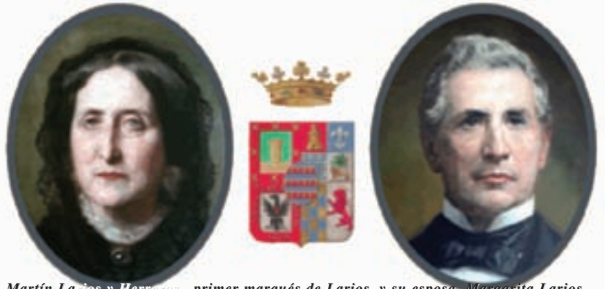
Martín Larios y Herreros, primer marqués de Larios, y su esposa, Margarita Larios.

Este estado de cosas empezó a cambiar en la época de Carlos III y Carlos IV en el último cuarto de siglo XVIII y en los primeros años del XIX con las Cortes de Cadiz, al aprobarse una legislación favorable a la agricultura y a los agricultores, en detrimento de los intereses y privilegios de la ganadería transhumante. Por ello, sobrevino la crisis de la cabaña ovina y