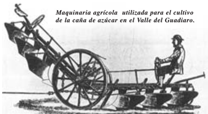
Maquinaria agrícola utilizada para el cultivo de la caña de azúcar en el Valle del Guadiaro.

poder económico e influencia que alcanzaron en la sociedad española y andaluza. Durante algo más de 40 años desarrollaron una intensa actividad económica en muy diversos sectores, aprovechando la transformación y modernización que estaba produciéndose en toda la sociedad española. Esta actividad fue